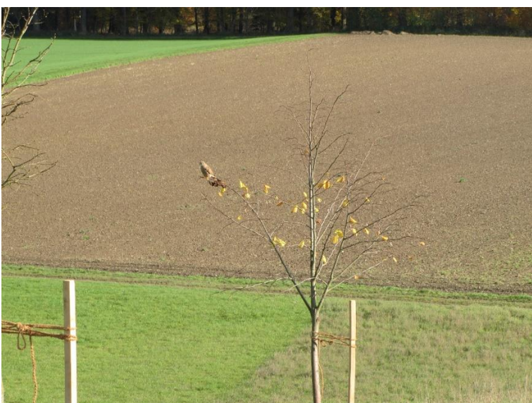
Auch dem Turmfalken macht die neu gepflanzte Linde Freude!