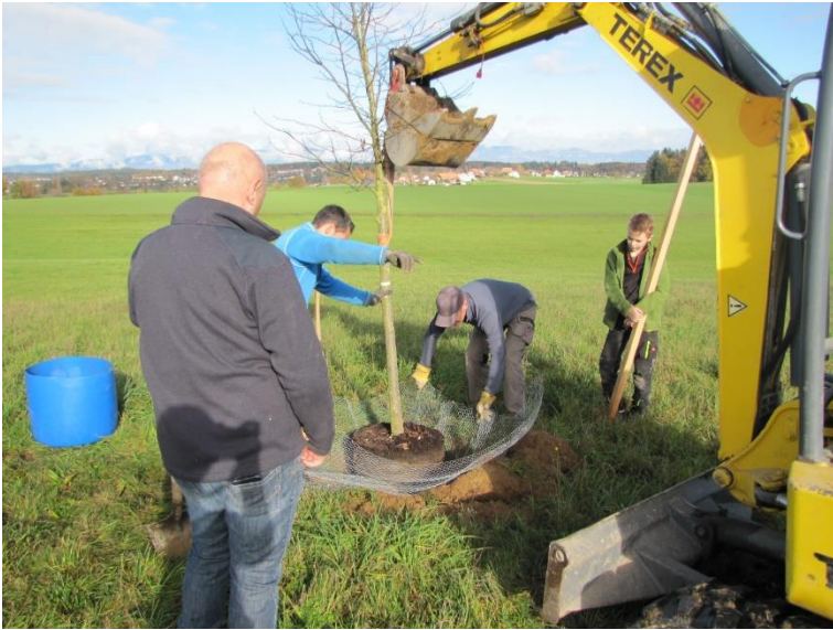
Ein Drahtgitter schützt die Linde vor einem späteren Mäusefrass.