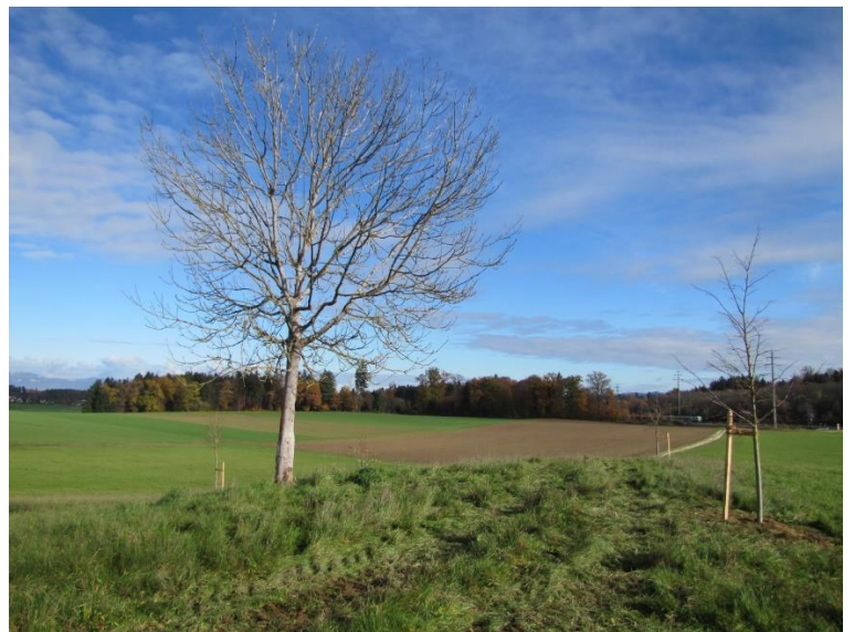
Die neu gesetzte Linde ersetzt die abgestorbene Esche.