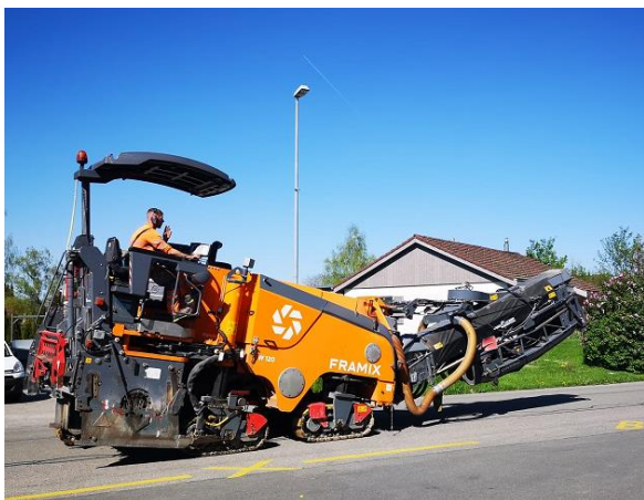
Es wird gefräst.

Der Deckbelag wurde in den Strassen vom Schuelhusbitz eingebaut.