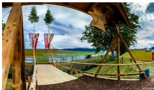
Festgelände mit 12 Ris

Die Teilnahme am Fest ist für alle lizenzierten Platzgerinnen und Platzger obligatorisch. Etwa 350 an der Zahl.