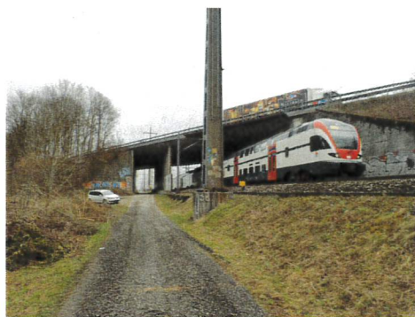
Die betroffene A1-Unterführung SBB Hardstrasse bei Hindelbank.

Die Arbeiten an der SBB-Unterführung unter der A1 bei Hindelbank verzögern sich um einige Wochen. Aufgrund neuer sicherheitstechnischen Vorschriften standen weniger Sperrnächte zur Verfügung, wodurch die Arbeiten länger dauern als geplant. Der Abschluss der Arbeiten ist nun auf Ende Februar 2023 vorgesehen.